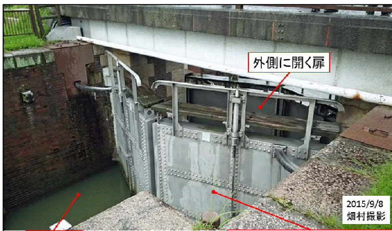
図5 船頭平閘門の扉

閘門の傍に、100年近く使われた実物の鉄板の閘門が展示されていた(図6)。幅約3m、高さ約7mの鉄板であった。1900年頃に作られたということが書いてあり、とても興味深かった。というのは、八幡製鉄がきちんと稼働して製品を出せるようになるまで、日本では大型の鉄板を作ることが出来なかった。1890年頃に日本古来の技術であったたたら製鉄は消滅する。それまで刀や農機具を使うのに使われていた地場の技術であるたたらでは、このような大きな鉄板や形鋼を作ること出来なかった。大きな鉄板を作ることが出来ないから、日本では鉄船を作ることが出来なかった。日清戦争や日露戦争では大体イギリスを中心とするヨーロッパから買った戦艦で戦争をしたのである。その治水用のものがこの鉄板で、おそらく輸入した鉄板で作ったものだろう。厚さはおそらく10mmぐらいだったと思うが良く覚えていない。たとえば、山陰本線の余部鉄橋