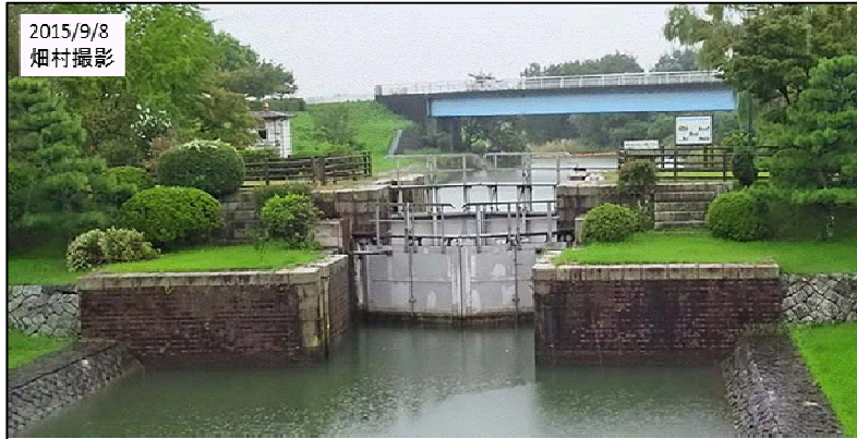
図4 船頭平閘門(せんだうひらこうもん)