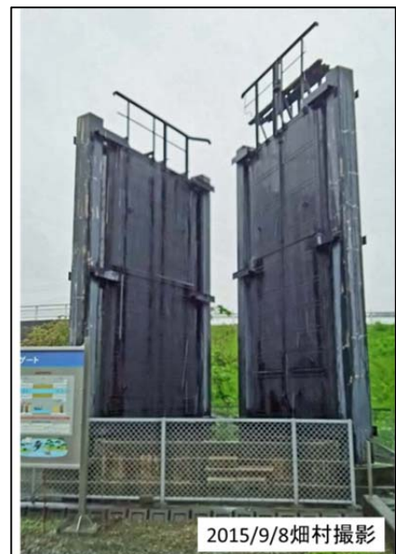
図6 船頭平閘門に使われていた鉄扉

閘門の傍に、100年近く使われた実物の鉄板の閘門が展示されていた(図6)。幅約3m、高さ約7mの鉄板であった。1900年頃に作られたということが書いてあり、とても興味深かった。というのは、八幡製鉄がきちんと稼働して製品を出せるようになるまで、日本では大型の鉄板を作ることが出来なかった。1890年頃に日本古来の技術であったたたら製鉄は消滅する。それまで刀や農機具を使うのに使われていた地場の技術であるたたらでは、このような大きな鉄板や形鋼を作ること出来なかった。大きな鉄板を作ることが出来ないから、日本では鉄船を作ることが出来なかった。日清戦争や日露戦争では大体イギリスを中心とするヨーロッパから買った戦艦で戦争をしたのである。その治水用のものがこの鉄板で、おそらく輸入した鉄板で作ったものだろう。厚さはおそらく10mmぐらいだったと思うが良く覚えていない。たとえば、山陰本線の余部鉄橋