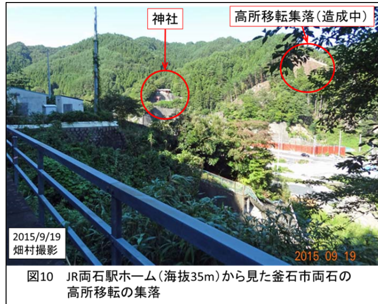
図10 JR両石駅ホーム(海拔35m)から見た釜石市両石の高所移転の集落

な高台がないため、山を削って宅地の造成をしているように見えた（図10）。あんな高いところに住居を作って人が住み続けることができるのだろうか？ たぶん海辺に近くないと漁業ができないという理由からああいうところを造成しているのだろうと思うが、一旦はそこに移り住んでも、いずれ漁業に不便だからという理由で、何十年か後には下に降りてきてしまうのではないかと思った。