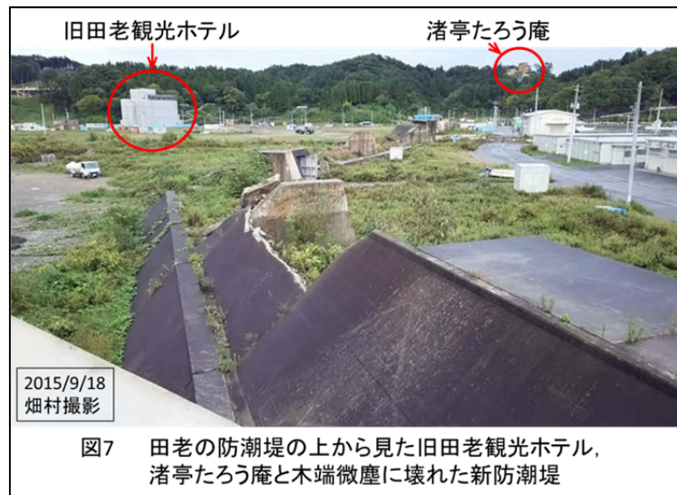
図7 田老の防潮堤の上から見た旧田老観光ホテル、渚亭たろう庵と木端微塵に壊れた新防潮堤

大槌町の方はまだ実際には何もできていなくて、地盤の嵩上げ用の土砂が 7~8m位の高さに積み上げられて、一見防潮堤のように見えた。しかし、これはいずれなくなって 15m の高さの防潮堤ができるという話を聞いた。15m の防潮堤というと、田老で見た 10m の防潮堤よりもずっと高いので、海の様子は全く見えなくなるということだ。