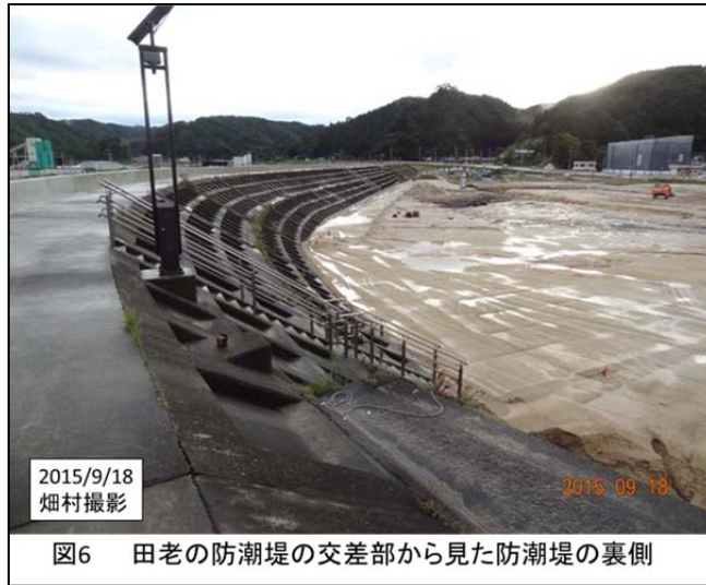
図6 田老の防潮堤の交差部から見た防潮堤の裏側