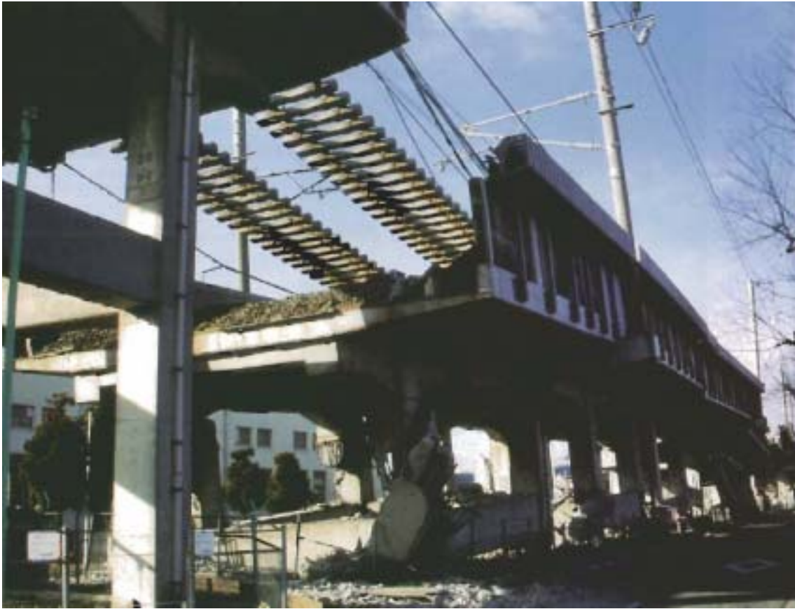
図4：山陽新幹線阪水高架橋の落橋