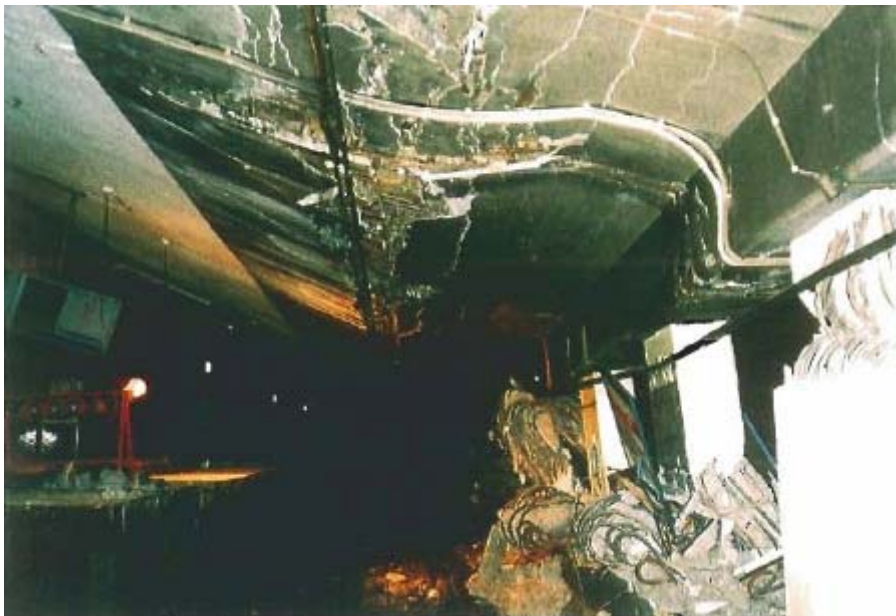
図5：神戸高速鉄道大開駅中柱の圧壊及び上床版の陥没