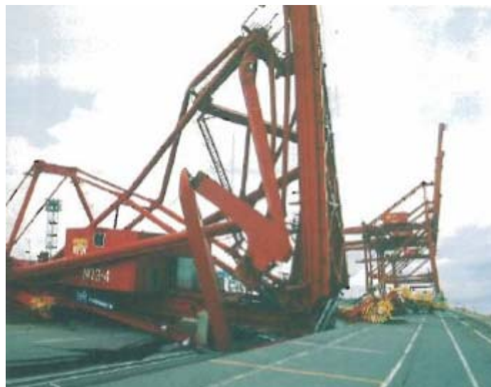
図6：クレーンの倒壊状況（六甲アイランド、RC3-4クレーン） （完全に倒壊したクレーンは一基だけだった。）