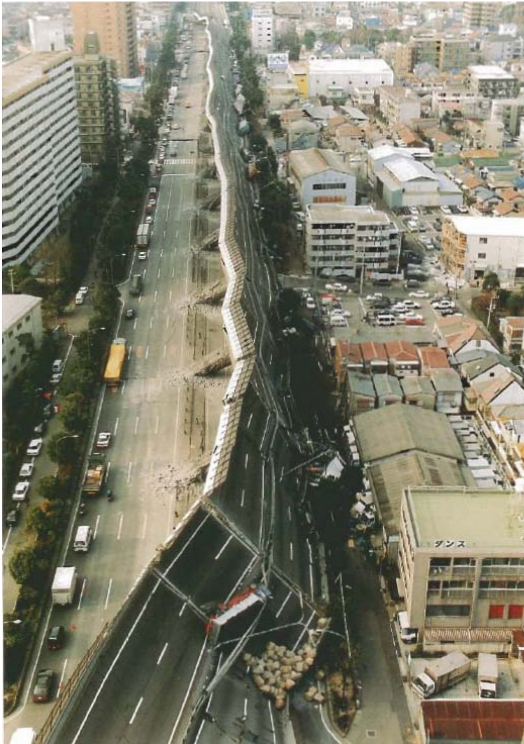
図 3 : 阪神高速道路 神戸線ピルツ高架橋の倒壊