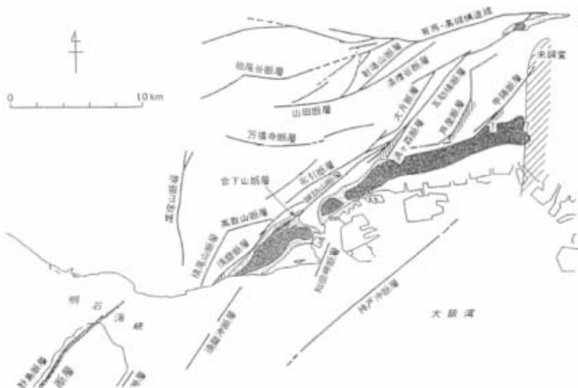
図2：阪神地域の断層分布図